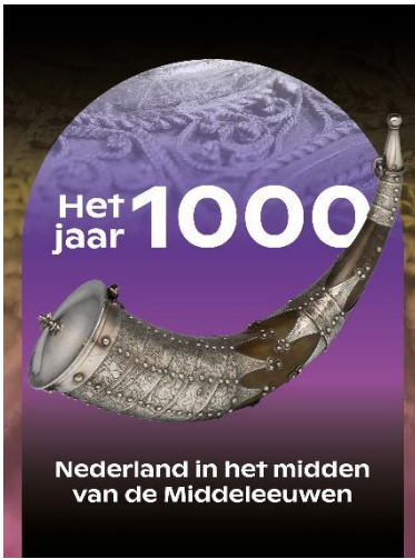
Campagnebeeld van de tentoonstelling In diverse formaten, met en zonder tekst